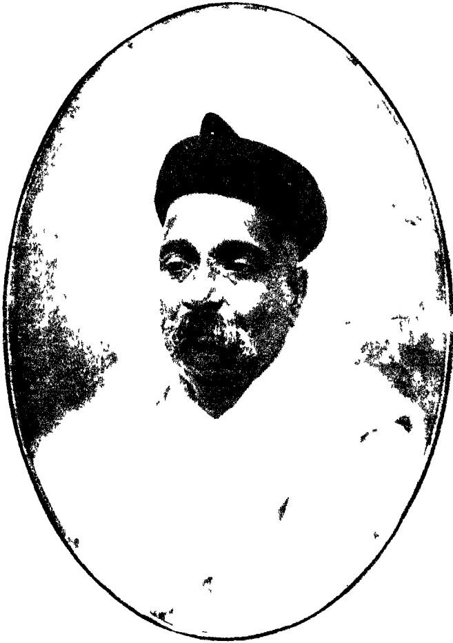
लोकमान्य तिलक ।